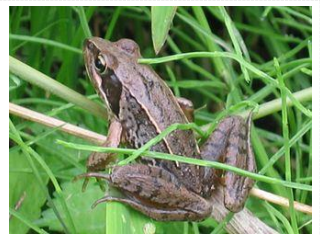
〔ニホンアカガエル〕