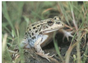
〔トウキョウダルマガエル〕