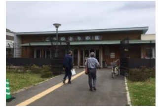
〔こうのとり飼育観察棟〕