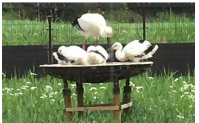
〔巣で3羽の幼鳥に餌を与える雌・コウちゃん〕