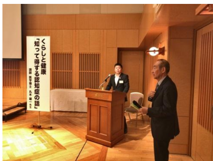
【講演会開会準備風景】