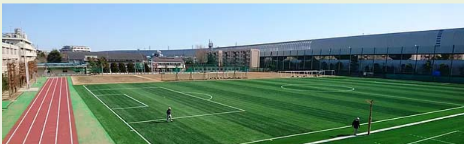
県内公立高校として初めて人工芝化した浦和南高校。早速全国大会に出場！

近年、県内でも、ラグビーやサッカーの強豪校の多くは人工芝のグラウンドに変えて、試合と同じ条件の中で練習を行っています。本校でも同様の環境を整えることで、部活動においても、さらなる活躍が期待できるものと思います。