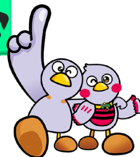
埼玉県マスコット 「コバトン」・「さいたまっち」