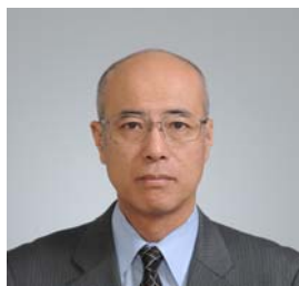
埼玉県立浦和高等学校長