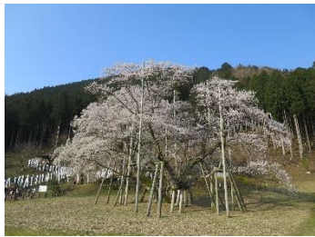
根尾谷の薄墨桜(岐阜本巣)

三春滝桜と共に日本5大桜の一つの石戸蒲桜（北本市）は、他の桜同様に今年は開花が早く、自粛騒ぎの前に満開になり、近場でもあることから早速愛でに行つたのですが、昨年の台風で幹から折れてしまい、悲惨な姿で出迎えてくれました。山高神代桜は何年も前から痛々しい姿でしたが、手厚い看護を受けて若干復活してきたとはいえ先は分かりません。狩宿の下馬桜も最盛期の半分くらいの樹勢で咲いています。自分や桜が逝ってしまう前に愛でておかないと・です。5大桜の根尾谷の薄墨桜と三春滝桜はまだ樹勢があり見事に咲き誇っていますので、皆さんも是非愛でに訪れてみてください。根尾谷の薄墨桜は、私が今まで見た桜の中でも一番風格があり見事な桜であると思います。今年は各地の花見の名所が立ち入り禁止となりましたので、その代わりにと言うと横暴ですが、私が勝手に選んだ名桜を掲載します。