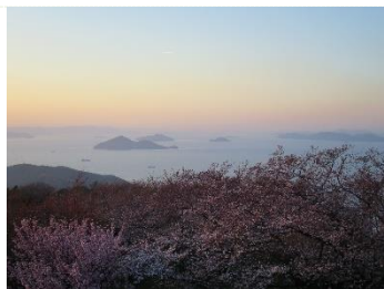
紫雲出山(香川三豊)