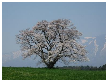
小岩井農場の1本桜(岩手雫石)